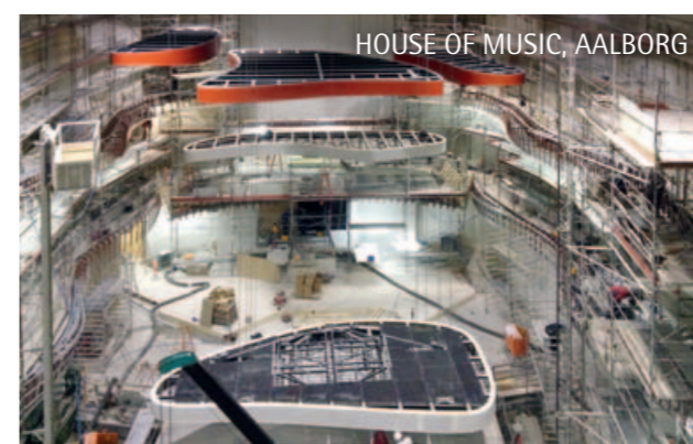
HOUSE OF MUSIC, AALBORG

Hier werden Kreativität und Know-how Wirklichkeit.