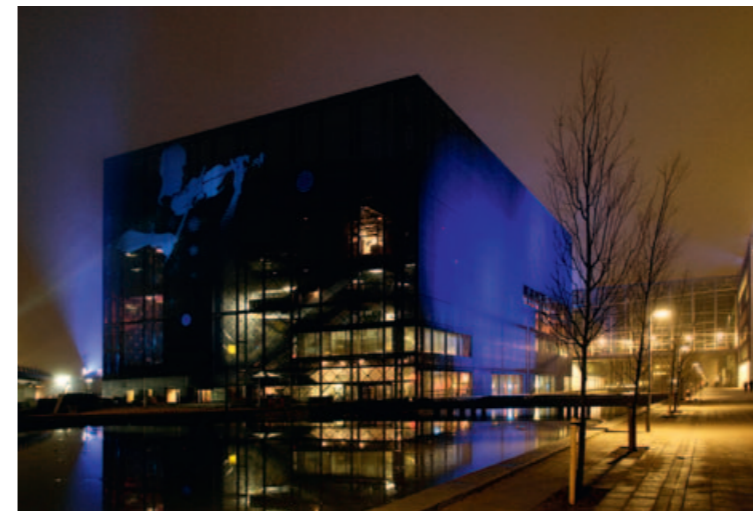
« DR BYEN CONCERT HALL, KOPENHAGEN »

Die neue Zentrale des dänischen Rundfunks verbindet in einem Stadtteil die Radio- und TV-Studios Kopenhagens sowie Administration und Technik. Das Konzerthaus von Jean Nouvel im Herzen des Gebäudekomplexes enthält neben dem großen Konzertsaal drei weitere Säle mit variabler Akustik. In enger Zusammenarbeit mit Architekt, Akustiker, Fachplaner und Betreiber entwickelte SBS Bühnentechnik alle mechanischen Einrichtungen für die akustischen und bühnentechnischen Elemente in den vier Sälen.