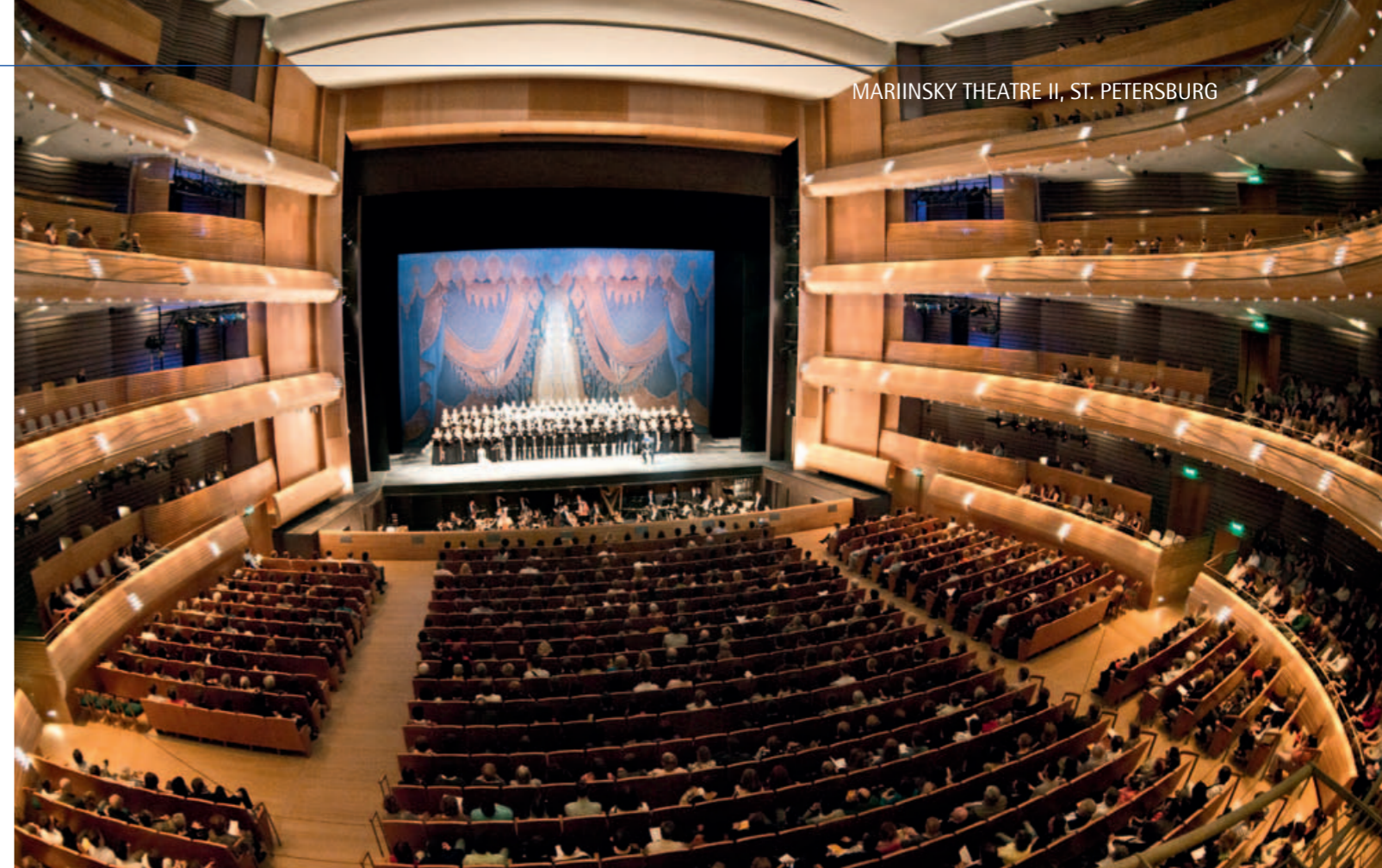
MARIINSKY THEATRE II, ST. PETERSBURG